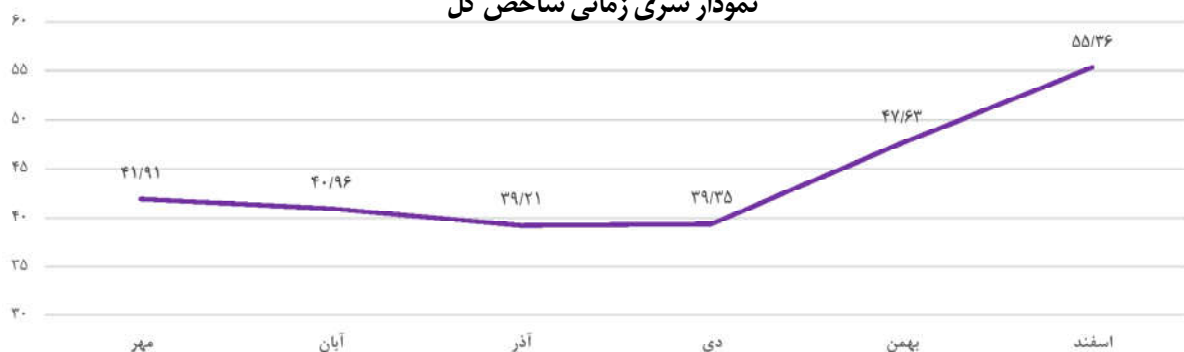
نمودار سری زمانی شاخص کل