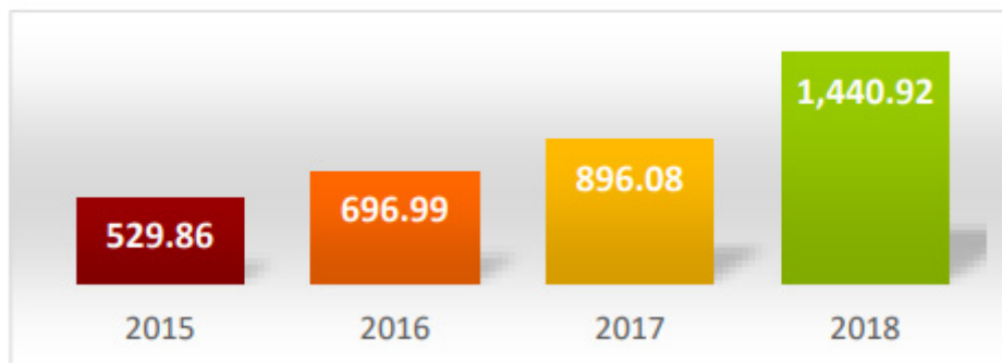
KTI Cargo traffic (ths. ton)

نمودار ۲- سهم قزاقستان، ترکمنستان و ایران از ترانزیت کالا از طریق KTI