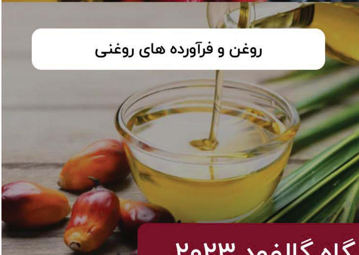
روغن و فرآورده های روغنی