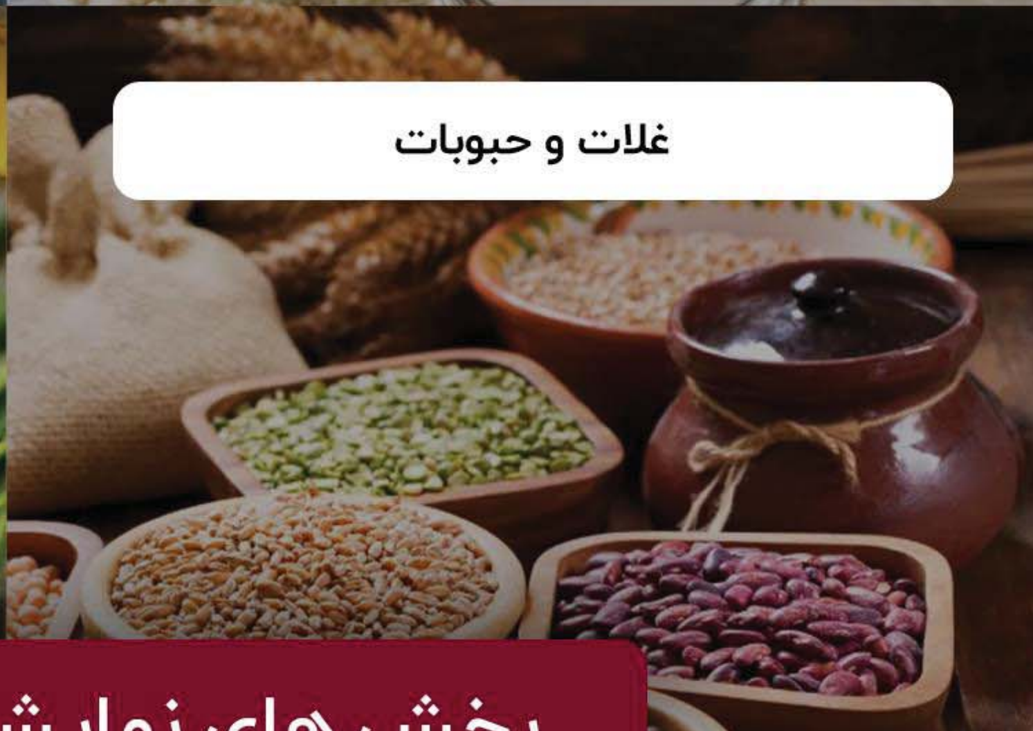
غلات و حبوبات