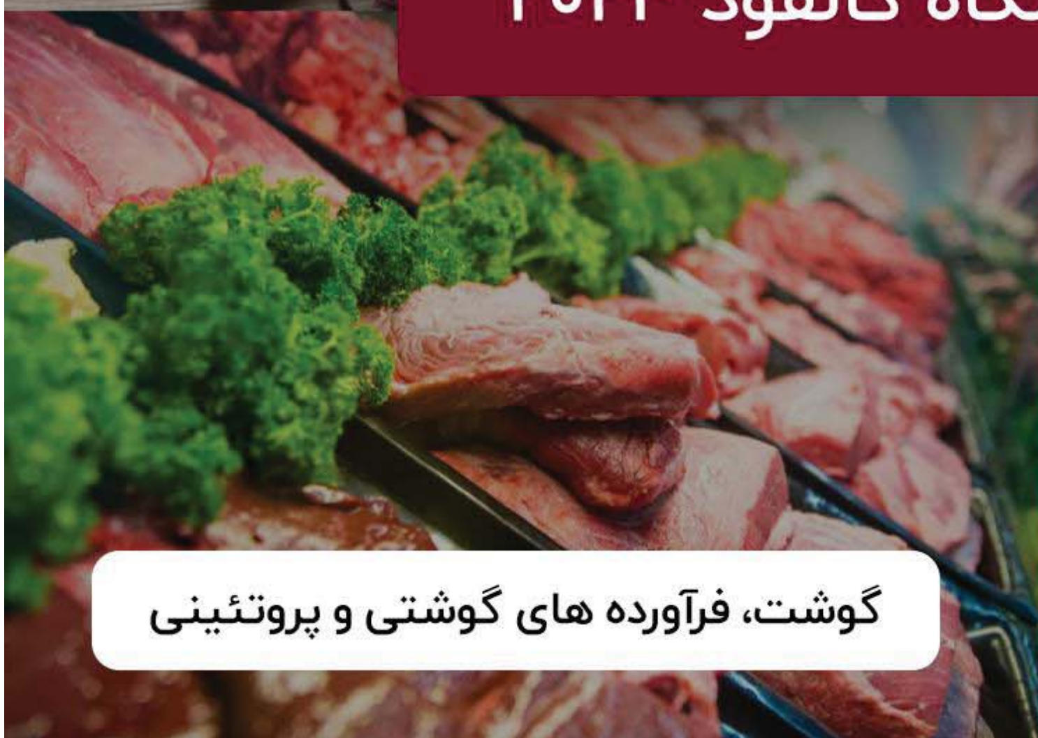
گوشت، فرآورده های گوشتی و پروتئینی