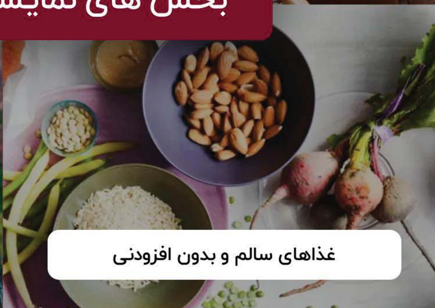
غذاهای سالم و بدون افزودنی