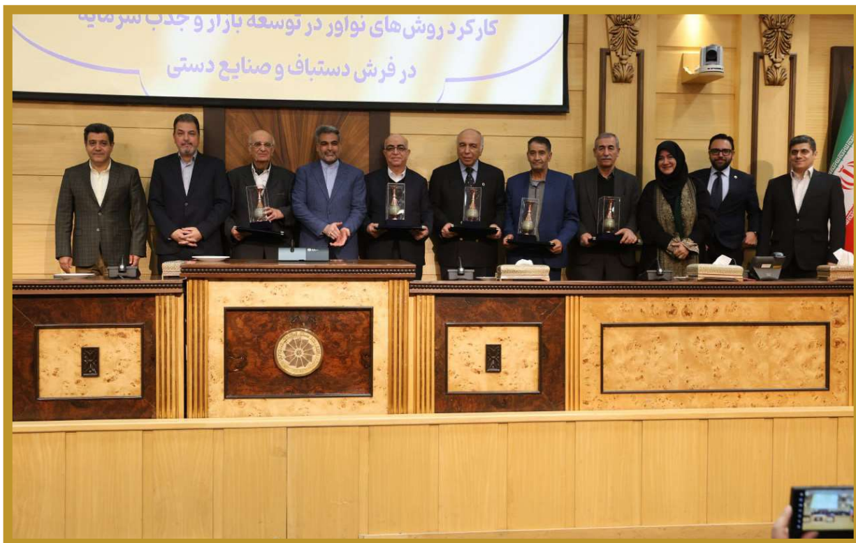
🕒 کلیدواژه: توسعه تجارت فرشت دستباف - صادرات - صنایع دستی - هنر